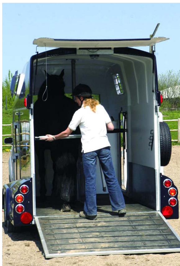
Pas på ikke at stå bag hesten, hvis den har tendens til at fare ud

En hjælper ved bagbommen kan også berolige hesten, og en hånd som støtte på bagparten, kan i nogle tilfælde være en hjælp