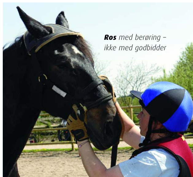
Ros med berøring – ikke med godbidder