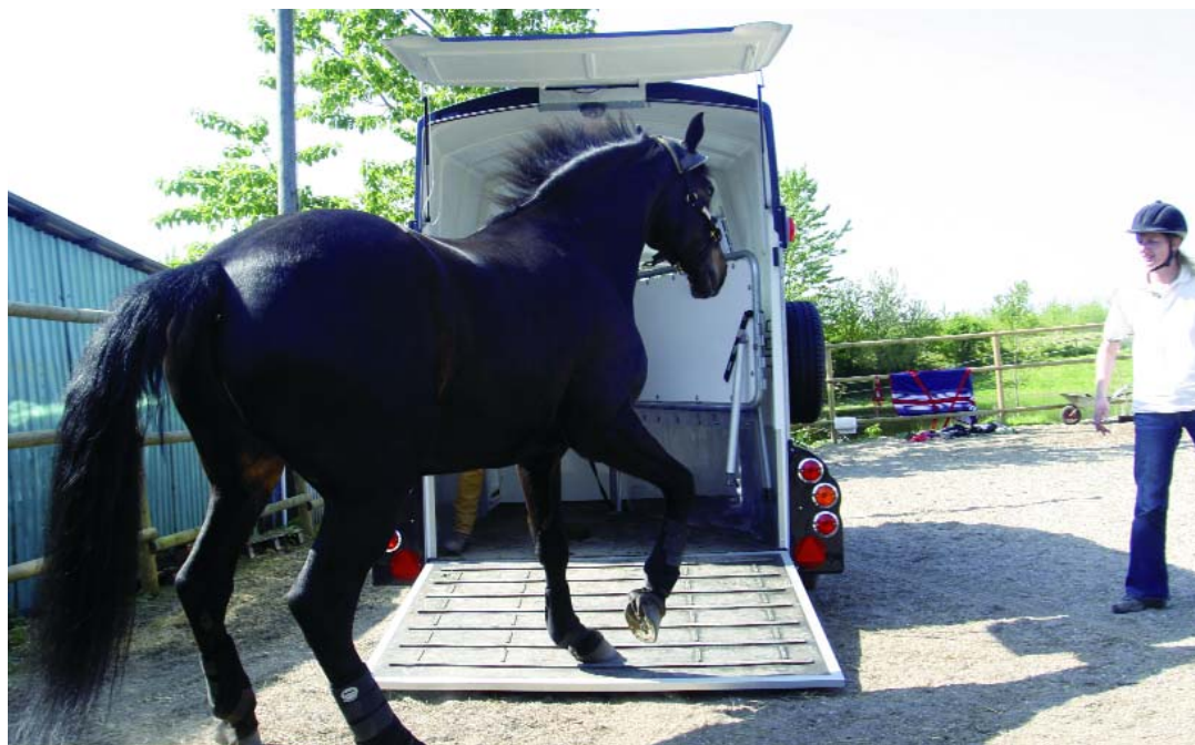
Parker i et hjørne , hvis hesten har lidt for travlt med at komme ud af traileren